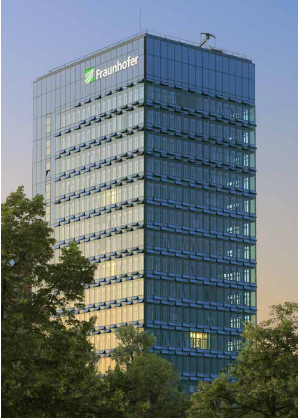
1 Markantes Hochhaus der Fraunhofer-Zentrale in München.