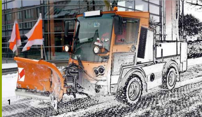
1 Kommunalfahrzeuge stehen im Fokus von HY 2 PE 2 R.